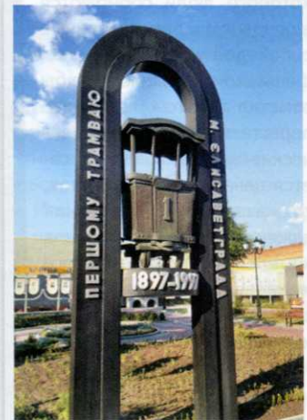
Памятник первому трамваю. Установлен в 1997 году.

расположенная по улице Шевченко. Она была создана Евгением Василенко в интересном стиле арт-сварки и по оригинальности оставляет далеко позади памятник Шевченко, который расположен в нескольких кварталах — ближе к педагоги-