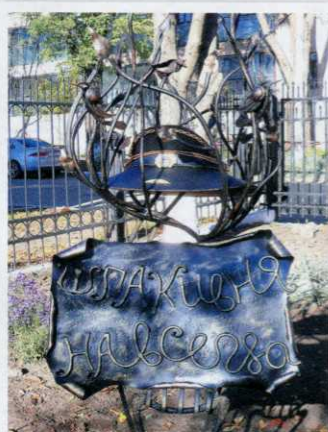
Памятник «Шлакивня навсегда». Установлен в 2010 году.

Если продолжать наше импровизированное путешествие по памятникам города, то, находясь на улице Колхозной, мы должны сделать первый выбор, куда направить стопы: вверх, в сторону летной академии, или вниз, к Ковалевскому парку?! Если уж мы хотим увидеть все по максимуму, то давайте от-