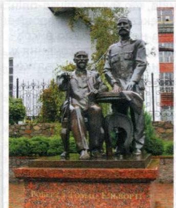
Памятник братьям Эльворти. Установлен в 2004 году.

Итак, двигаясь по маршруту, мы попадаем к Площади ангела. Это название прижилось среди народа, а официальное название — площадь Независимости — не смог назвать ни один человек, которого я спрашивал. Как вы помните, в свое время были приведены десятки объяснений необходимости возникновения этого комплекса — тут тебе и святая