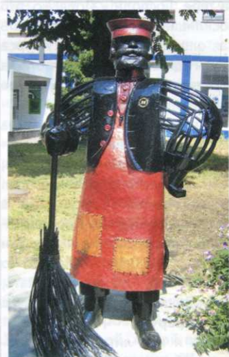
Полюбоваться памятником Дворнику вы сможете теперь лишь на фото.

Также не могу не уделить внимание памятнику Богдану Хмельницкому и памятнику жертвам Чернобыльской трагедии на набережной. Что касается последнего, то он по праву считается одним из самых интересных и концептуальных, пусть и скорбных, монументов нашего города. Женщина, распростершая руки,