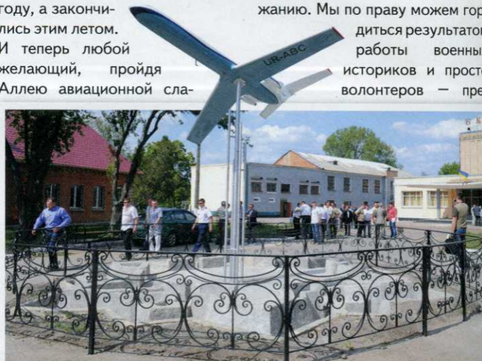
Я бы назвал этот памятник «Кировоград — Летающая столица»: сверху самолет, внизу — очертания земляной крепости, давшей начало городу.

Поэтому мы возвращаемся по улице Короленко и направляемся к центру города по улице Полтавской. Я специально выделил кировоградский памятник «Катюше», отреставрированный общественной организацией «Автоветеран», ведь это пример энтузиазма, достойного подражанию. Мы по праву можем гордиться результатом работы военных историков и просто волонтеров — пре-