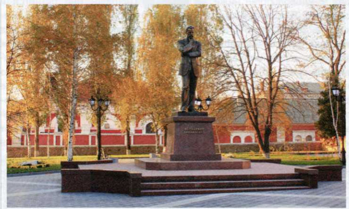
Памятник В. Винниченко. Установлен в 2010 году.