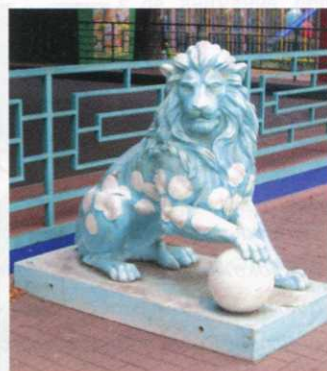
В дендропарке пока памятников нет, но их роль успешно выполняет вот этот симпатичный лев, очень популярный среди детишек!

Еще по 8% голосов досталось идеям памятников дворнику и интеллекту, 5% — памятнику пешеходу, а остальные голоса разделились между памятниками чиновнику, Ильину как символу жадности, а также Ильину как личности, причастной к съемкам в городе сериала «Синдром Дракона». Наверное, для хохмы и лучшего результата надо было