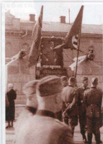
Фото сороковых годов прошлого века — времени оккупации Кировограда.

ческому университету. Правда, митингующих членов «Партии зеленых» или Гринписовцев в День защиты природы Стрекоза пока не собирает — в отличие от Кобзаря, у которого по праздникам встречаются местные представители политических партий. Тем не менее, потенциал у нее есть. Кстати, и Лавочку, и Стрекозу, к счастью, постигла более завидная участь, нежели еще один оригинальный проект — памятник Дворнику. Простоял он очень недолго на куске земли в два квадратных метра возле телеграфа. Внезапно оказалось, что данный участок земли находится в аренде у частного предпринимателя, который выступил против того, чтобы дворник украшал данный уголок города. Так что автор скульптуры забрал ее к себе, а немногим, кто успел сделать снимки с Дворником, остались на память лишь фото.