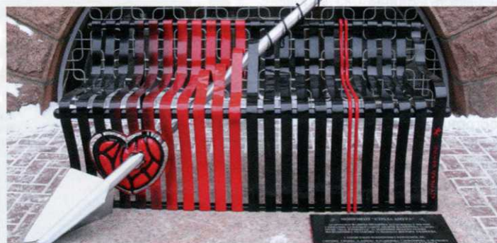
Памятник «Стрела Амура». Установлен в 2009-м году.

За приятной беседой мы дошли до памятника первому трамваю, который расположен в облагороженном в прошлом