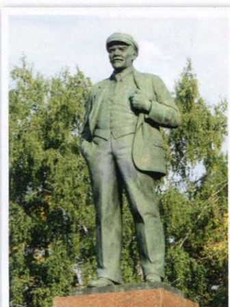
Один из первых памятников Ленину в мире. Установлен в 1920-х годах.

му, очевидно, и ходят слухи, что памятник перенесут на Крепостные Валы.